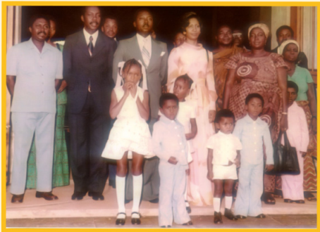
Photos du mariage chrétien, à l'église Notre Dame d'Afrique de Biétry le 16 / 11 / 1974